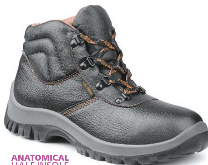
ANATOMICAL HALF INSOLE