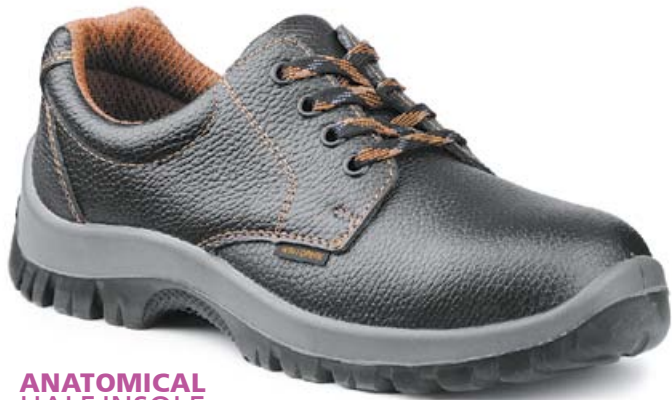
ANATOMICAL HALF INSOLE