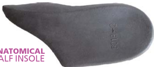
ANATOMICAL HALF INSOLE