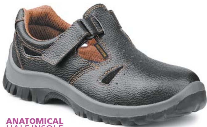
ANATOMICAL HALF INSOLE