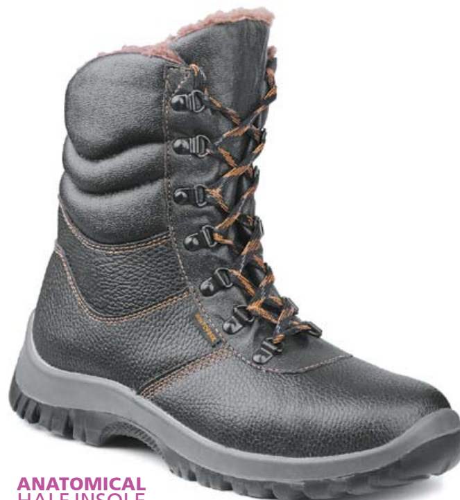
ANATOMICAL HALF INSOLE