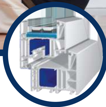
bluEvolution: 82 AD