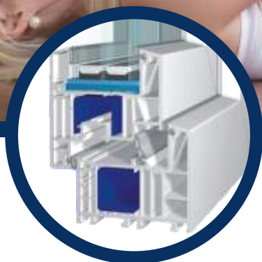
bluEvolution: 82 MD